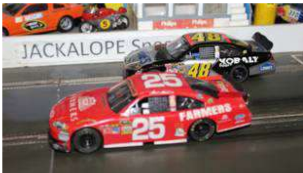
Knapper Zieleinlauf auf 2 und 3

zwar für schnelle Einzelrunden gut war, auf Dauer aber zu instabil in der Links-Rechts- Kurvenkombination Schwierigkeiten hatte. Kens Ford #82 wurde zum Verhängnis, dass die Abstimmung wohl zu sehr auf Ovalstrecken ausgelegt ist und er in Rechtskurven zur Hecklastigkeit neigt.