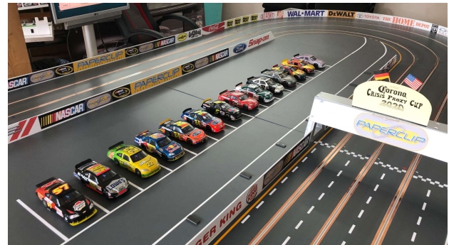
Parken nach Qualy-Rangliste

Nachdem am Vortag das freie Training auf der Short Track Ovalstrecke „Paperclip“ überraschenderweise sehr erfolgreich für alle Teams verlief, gab es heute doch wieder etwas deutlichere Unterschiede beim Fahrverhalten in der von Tom durchgeführten Qualy. So hatten einige auch mit Abflügen zu kämpfen. Die # 5 von Robin hat wohl ein größeres Problem mit einem abgenutzten Getriebe. Nach Begutachtung des Schadens entschied sich die Rennleitung trotzdem für einen Start in diesem Zustand. Vor dem Rennen auf dem größeren Speedway sollten die Mechaniker aber dann einen Tausch des Getriebes erwägen.