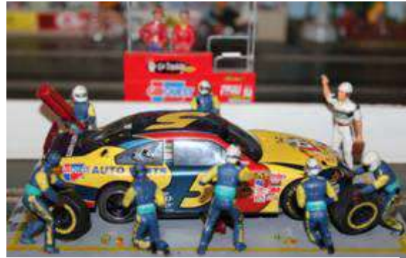
Die Kellogg's Pitcrew hatte viel zu tun

War man sich bereits nach dem ersten gefahrenen Metern im Vortest sicher, dass Toms #22 Subway-Chevy das zu schlagende Fahrzeug sein werde, so gab es hier eine Überraschung als dieser als letzter im Rennen auf die Bahn ging. Nach anfänglichen Rekordrunden, die bis zu 2/10 schneller als die der im Klassement folgenden Autos waren, fing der Motor ab ca 35 Runden an langsamer zu laufen. Die mangelnde Leistung wurde durch mehr Gasgeben ausgeglichen, wodurch der Motor plötzlich wieder hochlief und das Auto unvermittelt die Begrenzungsmauer flog. 4 dieser Crashes ließen die #22 stark zurückfallen. Ähnliches Verhalten zeigte auch Jorge's #24 Chevy, der danach rundenlang mit Zeiten um die 6 Sekunden um den Kurs schlich und bis auf Platz 7 durchgereicht wurde. Beider Motoren erholten sich jedoch in den letzten Runden wieder und es konnte weiteres Zurückfallen vermieden werden.