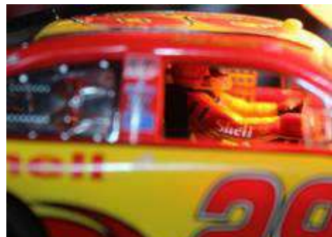
#29 Schönstes Auto im Feld mit Fahrer in Sponsoren-Overall

Gerhards #25 und Horsts #48 profitierten von diesen Defekten und landeten um nur 16/100 getrennt auf den beiden Podiumsplätzen hinter dem siegreichen Pizza Hut #57 von Tom, der einwandfrei lief. Robins Kellogg's #5 konnte seinen kurzen Höhenflug im Qualifying nicht halten und landete im hinteren Feld ebenso wie Mikes #69, der