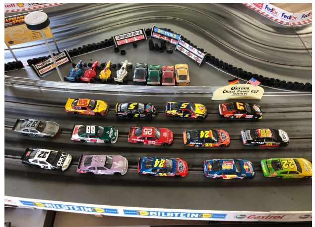
Hat Spass gemacht!